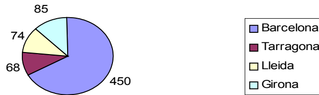
Nombre d'ONGD detectades per demarcació (incloent-hi les federades)